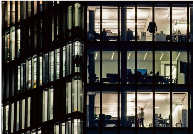
Nachtarbeit ist ein gewichtiger Stressfaktor: Büros im Zürcher Prime Tower.

Aggressive Kunden und belastende Arbeitszeiten machen immer mehr Arbeitnehmenden zu schaffen. Das zeigt die erste Auswertung einer Seco-Studie bei 400 Unternehmen.